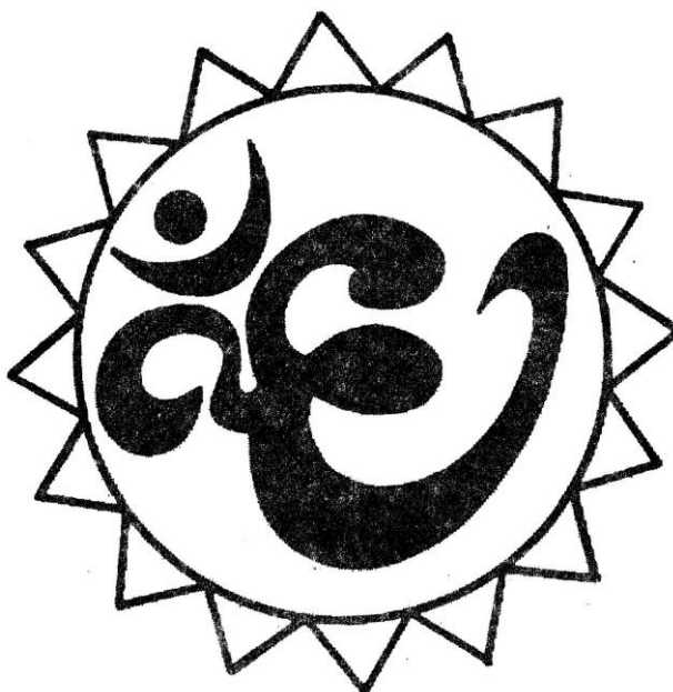
Рисунок для фиксации глаз

Вариант 3. Вокруг знака проведена окружность. Перемещайте свой взгляд по окружности, двигая одновременно глаза и голову. Делайте упражнение вначале с открытыми глазами, затем с закрытыми, представляя окружность.